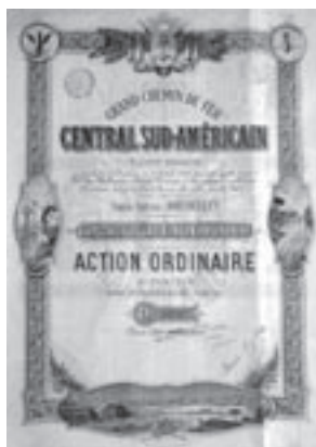
Los Nr. 675

Los Nr. 674 FURTSCHELLAS-BAHN AG /CH Gültige Aktie über 500 Franken. Sils im Engadin, 21. März 1972. Blau. 1987 wurde der Nennwert auf 200 Franken reduziert. Preis: CHF 150 / € 94 EF