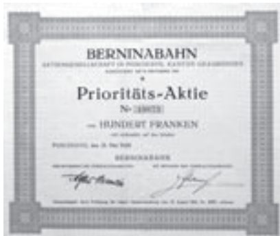
Prioritätsaktie über 100 Franken. Poschiavo, 21. Mai 1924.

Das Kapital betrug neu Fr. 4.26 Mio. in Prioritätsaktien und Fr. 0.901 Mio. in Stammaktien, die in Fr. 4.26 Mio. Prioritätsaktien der RhB und Fr. 0.901 Mio. Stammaktien der RhB umgetauscht wurden.