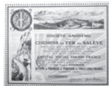
Los Nr. 703

Los Nr. 702 RORSCHACH-HEIDEN-BERGBAHNGE- SELLSCHAFT /CH Gültige Aktie 1. Rang über 500 Franken. Basel, 6. Juni 1874. Rosa. Top- Erhaltung. Preis: CHF 400 / € 250 UNC