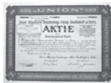
Los Nr. 829