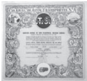
Los Nr. 505

Los Nr. 504 BAYERISCHE MOTORENWERKE AG /D Aktie über 1'000 Reichsmark. München, im April 1927. Blau/braun. Unentwertet. Preis: CHF 60 / € 38 EF