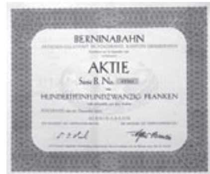
Aktie Serie B über 125 Franken. Poschiavo, 20. Dezember 1933

Bis Ende 1906 waren 60 % des Aktienkapitals einbezahlt; am 30. Juni 1908 wurde die letzte Rate eingefordert. Gleichzeitig wurde mit der Eisenbahnbank eine 4.5%ige Anleihe über 7 Mio. Franken aufgenommen.