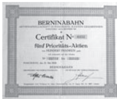
Zertifikat über 5 Prioritätsaktien. Poschiavo, 21. Mai 1924