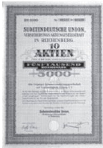
Los Nr. 828