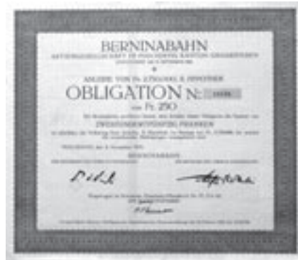
Obligation über 250 Franken. Poschiavo, 6.11.1933.