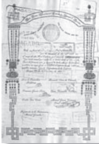
Los Nr. 807

nur Schätzpreis / Schätzpreis in CHF und €