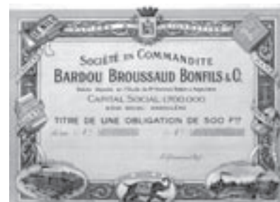
Los Nr. 780

Los Nr. 780 SOCIÉTÉ DEN COMMANDITE BARDOU BROUSSAUD BONFILS & CO /F Obligation über 500 Francs. Angoulême, undatiert. Rotbraun. Blankett. Die Gesellschaft produzierte u.a. Zigarettenpapier. Preis: CHF 120 / € 75 UNC