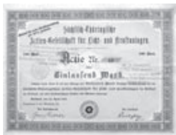
Los Nr. 741