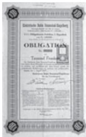
Los Nr. 668

Los Nr. 668 ELEKTRISCHE BAHN STANSSTAD-ENGBERG /CH Obligation über 1'000 Franken. Luzern, 01.08.1927. Braun. Hochformatig mit roter Blindprägestempelmarke. Preis: CHF 390 / € 244 EF