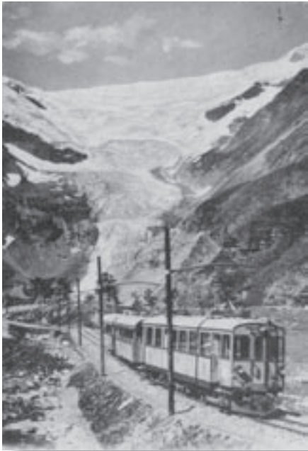
Berninabahn mit Palüglletscher

Neben den grossen Alpentransitbahnen St. Gotthard, Simplon, Brenner und Mont Cenis gibt es im schweizerischen Alpengebiet noch eine weitere Nord-Süd-Route: Die Bernina-Strecke der Rhätischen Bahn. Die rund 61 Kilometer lange Verbindung von St. Moritz in das italienische Tirano ist ein technisches Wunderwerk in einer eindrucksvollen Landschaft.