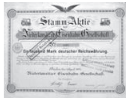
Los Nr. 697

Los Nr. 697 NIEDERLAUSITZER EISENBAHN-GESELL- SCHAFT /D Stammaktie über 1'000 Mark. Ber- lin, 1.4.1898. Gründerstück. Die Bahn hatte ein Streckennetz von 113 km, das von Falkenberg über Uckro, Luchaum, Lübben nach Beeskow ging. Dekorativ mit Abb. Von zwei alten Loko- motiven und geflügeltes Rad. Preis: CHF 200 / € 125 VF