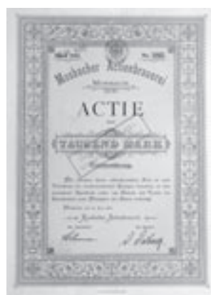
Los Nr. 575

Los Nr. 574 MAINZER ACTIEN-BIERBRAUEREI /D Aktie über 300 Reichsmark. Mainz, 1. Januar 1873. Gelb. Unentwertet. Preis: CHF 170 / € 106 EF