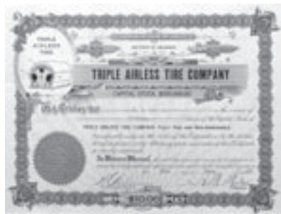
Los Nr. 606

Los Nr. 604 RODI & WIENENBERGER AG /D Aktie über 1'000 Reichsmark. Pforzheim, im Juli 1899. Grüngelb. Unentwertet. Preis: CHF 130 / € 81 EF