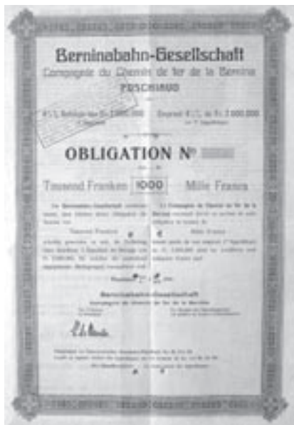
Obligation über 1'000 Franken. Poschiavo, 3.6.1908. Älteste verfügbarer Titel der Berninabahn.

In den Folgejahren konnte die Bahn erhebliche Überschüsse erzielen; für das Prioritätskapital wurden sogar Dividenden gezahlt. Mit dem Einfluss des ersten Weltkrieges kamen Schwierigkeiten. Am 01.03.1917 wurden die Zinszahlungen eingestellt und gestundet. Am 03.04.1922 trat ein ungeduldig gewordener Besitzer zweier Obligatio-