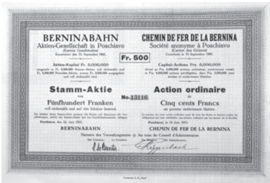
Stamm-Aktie über 500 Franken. Poschiavo, 12. Juni 1913. Ausgegeben anlässlich der ersten Sanierungsrunde

In der Generalversammlung des Jahres 1913 wurden umfassende Sanierungsmassnahmen beschlossen. Das Aktienkapital wurde von 6 auf 4 Mio. Franken durch Zusammenlegung von drei zu zwei Aktien reduziert. Neu geschaffen wurde ein Prioritätskapital von 4 Mio. Franken, von dem 2 Mio. Franken sofort ausgegeben wurden. Das Aktienkapital betrug neu 8 Mio. Franken, eingeteilt in 8'000 Prioritäts- und 8'000 Stamm-Aktien zu je 500 Franken Nennwert.