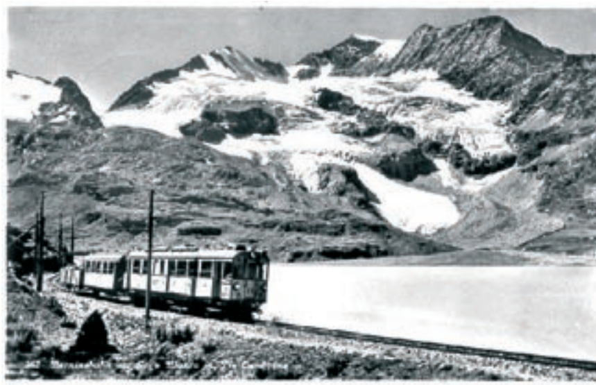
Berninabahn vor Lago Bianco und mit Piz Cambrena

Insgesamt befanden sich nach dieser Sanierungsrunde 27'000 Prioritäts- und 18'000 Stammaktien mit einem Nennwert von jeweils 100 Franken im Umlauf.